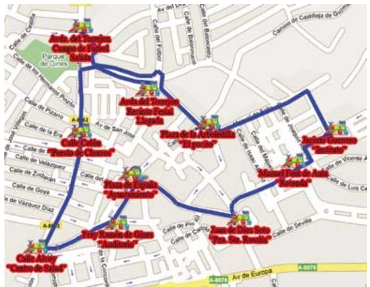
TREN TURÍSTICO GRATUITO Recorrido