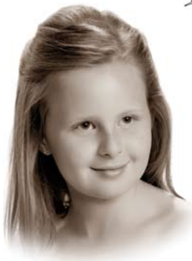
Dama de Honor