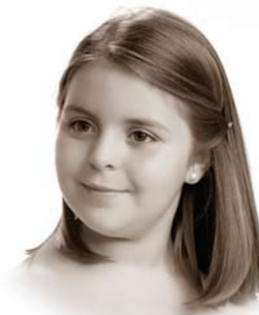
Dama de Honor