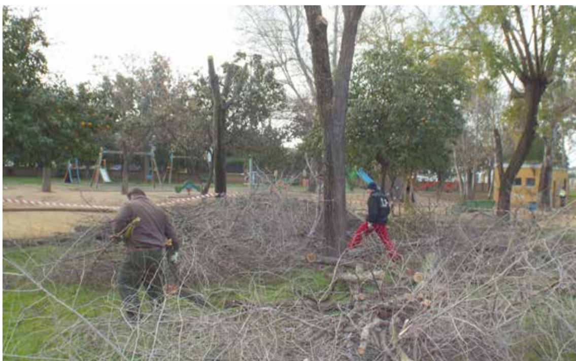
Trabajadores de Medio Ambiente realizan las labores de poda.