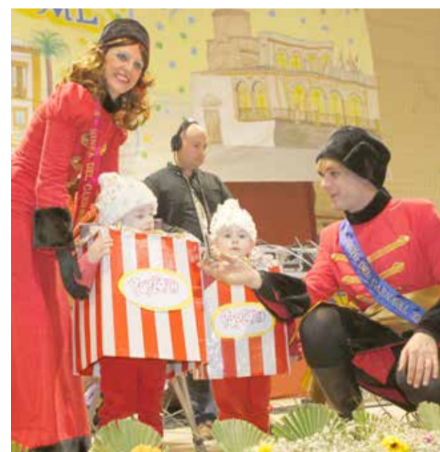
El premio al mejor disfraz masculino infantil se lo llevaron "Las palomitas"