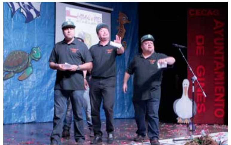
El trió Los Piquislavis en la Gala Inaugural.