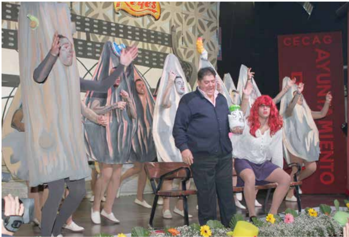
El primer premio de chirigotas fue para "Los Reyes"