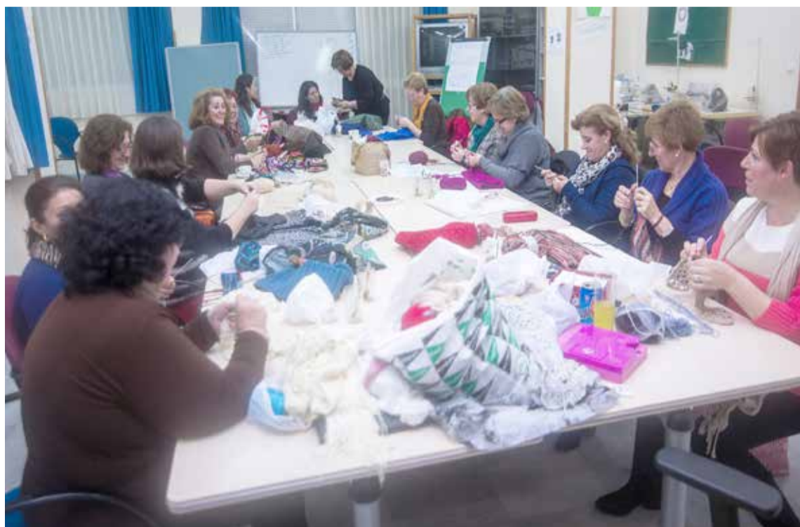
Cerca de 30 mujeres aprenden croché en la Casa Amarilla

de experiencia en este tipo de labores. Durante tres horas, las alumnas aprenden las infinitas posibilidades creativas y de diseño que posee la modalidad del croché, realizando su propia ropa tales como trajes de flamenca, chalecos, chaquetillas, mantones, complementos e incluso bikinis. La clase está compuesta por mujeres de entre 30 y 60 años y pretende dar respuesta a la gran demanda surgida en los últimos años alrededor de los trabajos con aguja de gancho.