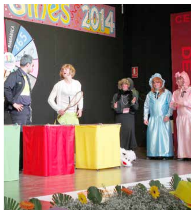
El primer premio de cuartetos fue para "1,2,3...responda Magüé".