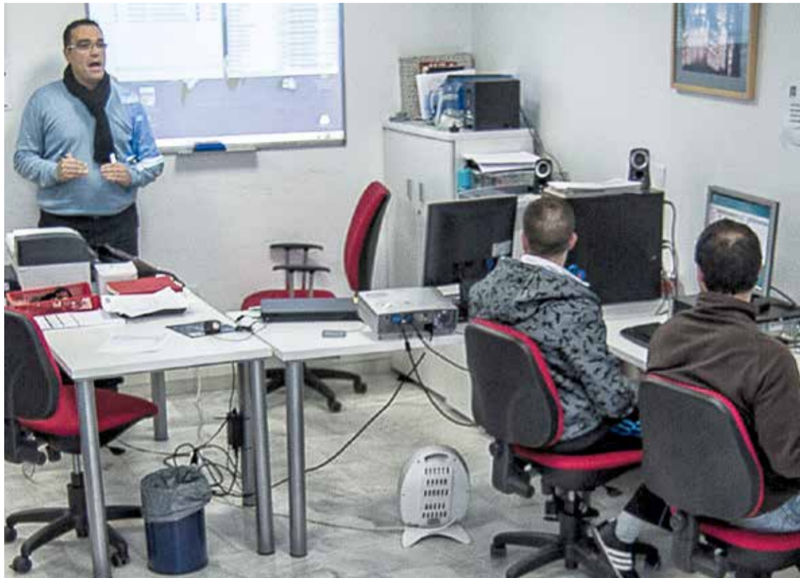
A diario desde Guadalinfo se imparten cursos relacionados con las nuevas tecnologías.

En contra de la idea generalizada, el centro Guadalinfo Gines, puesto en marcha por el Ayuntamiento en 2010, es mucho más que un lugar de libre acceso a Internet o un espacio virtual donde iniciarse en las nuevas tecnologías. Hace tiempo que ha orientado sus pasos a facilitar al usuario la búsqueda de trabajo y al asesoramiento en nuevas iniciativas empresariales. Desde 2011, Guadalinfo Gines, y los casi 800 centros existentes en Andalucía, han entrado de lleno en una tercera etapa denominada como "innovación social", que supone una mayor implicación de estos lugares virtuales con el entorno laboral. Situado en la Casa de la Juventud, en la calle Fray Ramón de Gines, el centro dirige sus esfuerzos actualmente hacia tres líneas fundamentales de trabajo: los cursos de formación a desempleados, la búsqueda de empleo y el emprendimiento. Para ello vienen potenciando una serie de alianzas tendentes a favorecer la interacción entre el mundo virtual, los individuos y las empresas.