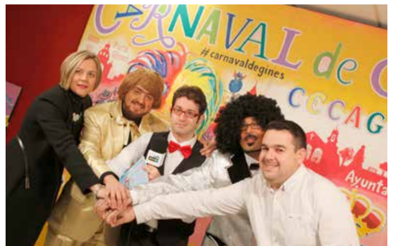
Parte del equipo que hace posible el Carnaval.

Tras la Gala Inaugural, el día 12 comenzaban las semifinales del Certamen Carnavalesco de Agrupaciones en Gines (CECAG), que volvió a batir todos los récords de los 25 años de historia del concurso con 50 agrupaciones inscritas. Llegados desde diferentes lugares de las provincias de Cádiz, Huelva y Sevilla, los grupos participantes demostraron un altísimo nivel sobre las tablas del Tronío, teniendo la organización que ampliar un día más esta fase previa debido al gran número de agrupaciones inscritas. Después de cinco días de semifinales, se clasificaron para la Gran Final del día 21 las 11 mejores agru-