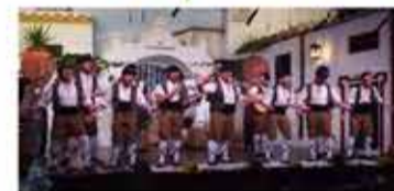
comparsa de Gines el Santo Angel