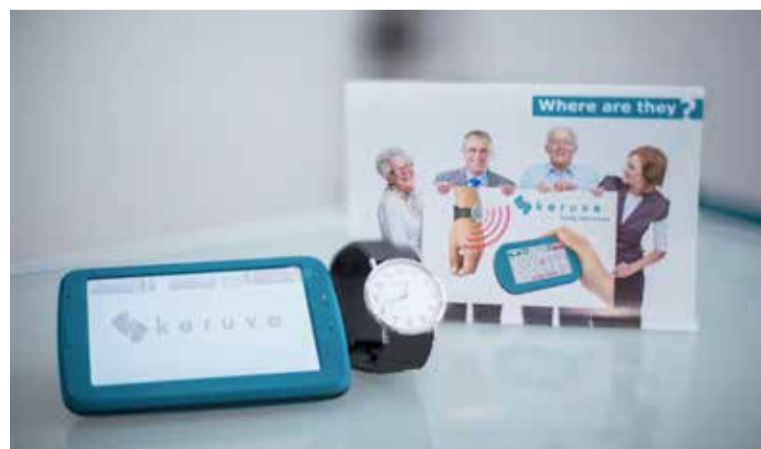
Keruve consta de un reloj con GPS y un receptor portátil

sede está ubicada entre los términos de Gines y Espartinas, y con filial en Toulouse cuenta con 17 empleados y venden al año en torno a 800 ejemplares habiéndose convertido en líderes y pioneros en un sector en el que no tienen competencia. “Si no existiéramos muchas personas estarían viviendo en peores condi-