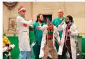
clínica privada sana sana culito de rana