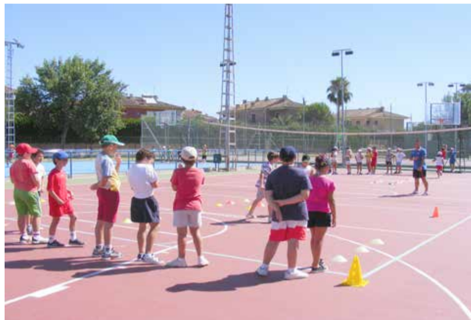
Más de 1.200 pertenecen a las Escuelas Deportivas Municipales