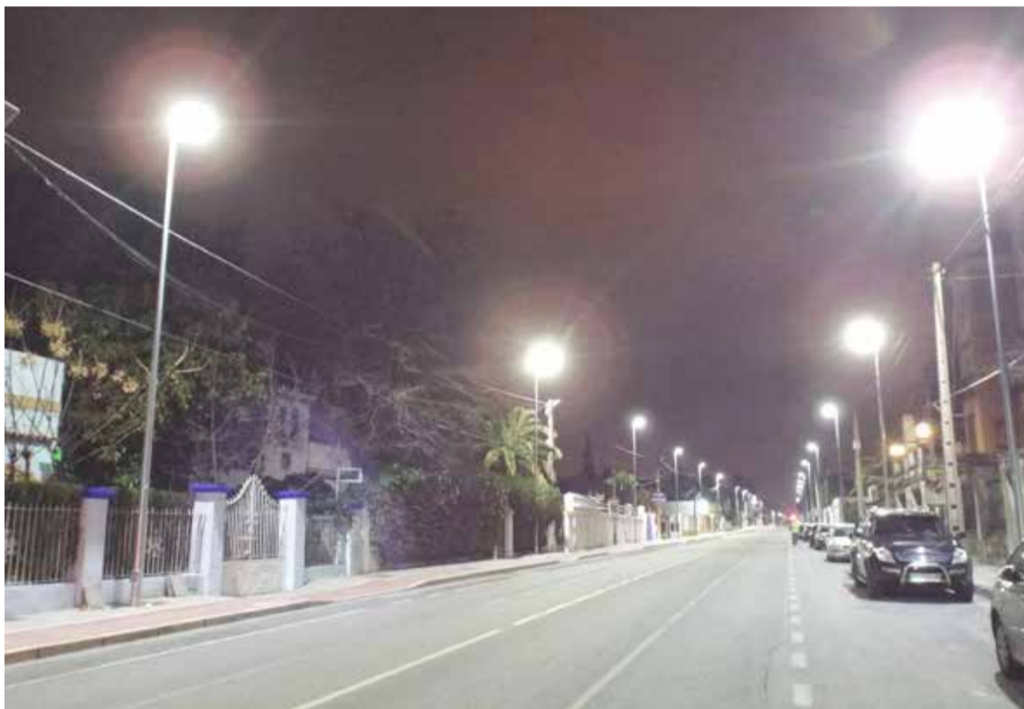
Aspecto de la Avenida de Europa con la nueva iluminación