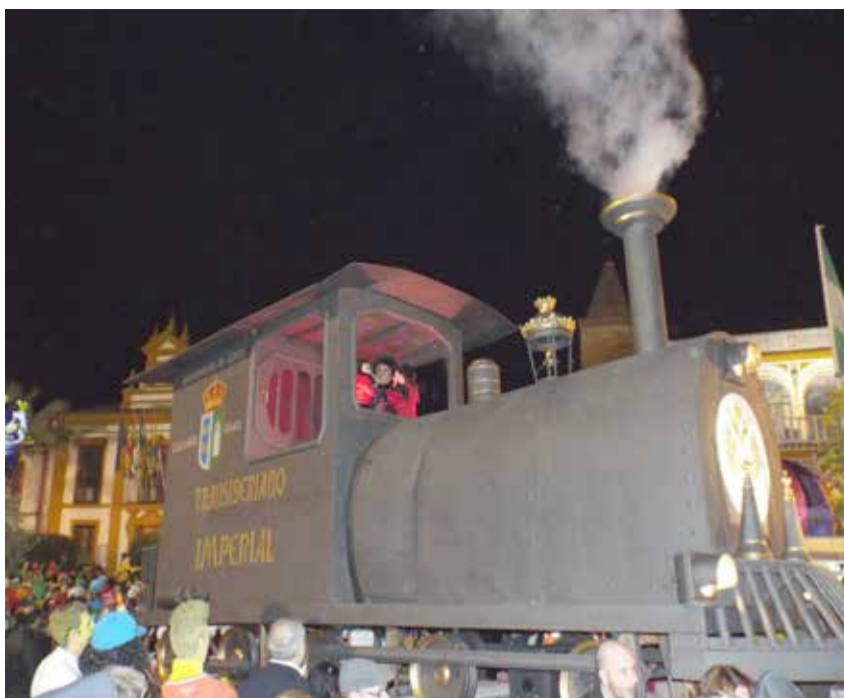
El espectacular carruaje de los Ninfos recrea el mítico Transiberiano.