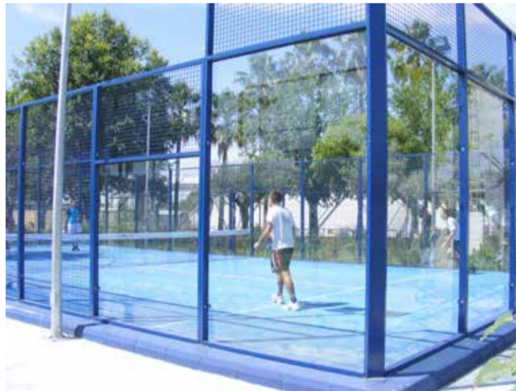
El deporte se practica en unas instalaciones de primer nivel.

sido remodelado en su totalidad recientemente creándose varias pistas de petanca, tenis y pádel, renovándose las pistas de baloncesto, voleibol y fútbol, se ha construido un nuevo Es-