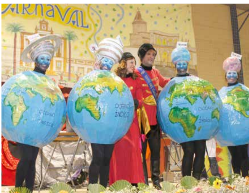
"Las bolas del mundo" ganaron el primer premio de grupo