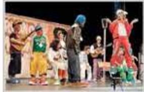
Chirigota de Sevilla Shunfenticos Chunguitos