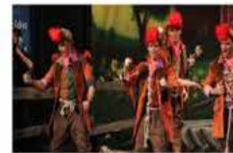
Comparsa Los Gallitos