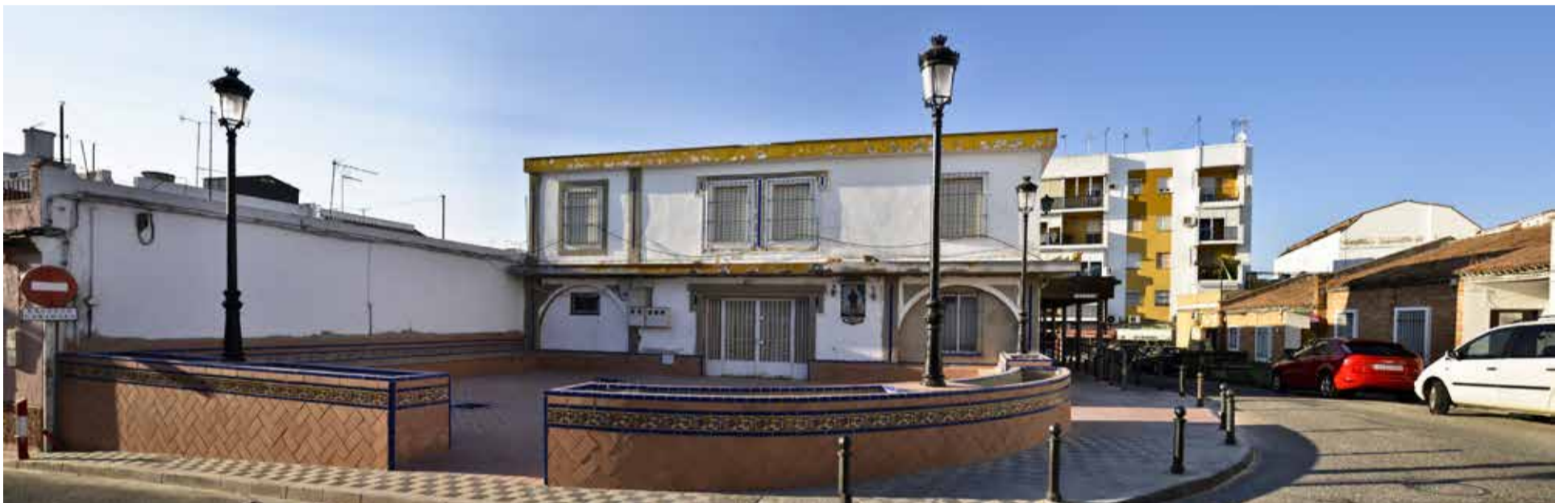
Aspecto actual de la Plaza del Sanatorio al cierre de esta edición.