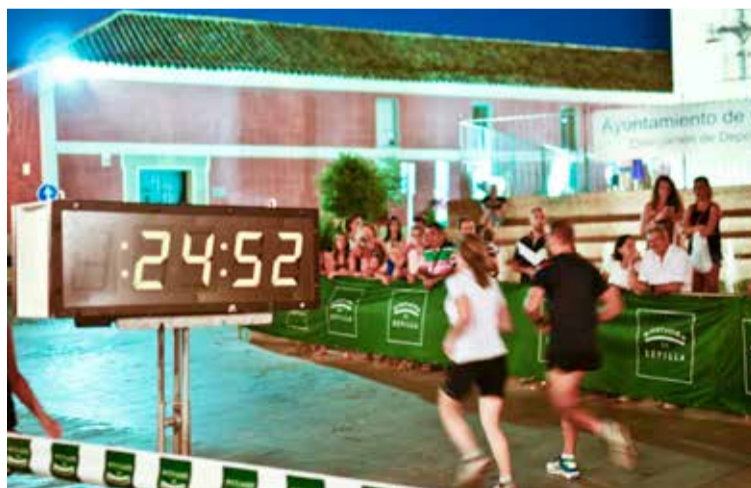
Cronómetro colocado en la línea de meta.