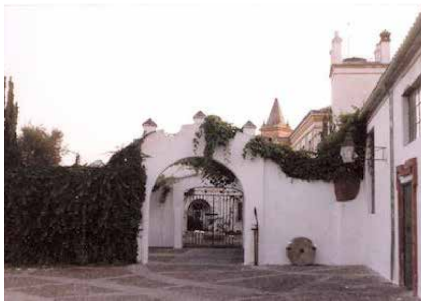
Una de las bellas imágenes que guarda El Molino.

necesaria la colaboración con el Ayuntamiento y se destacan muy positivamente los pasos que se están dando en este sentido por conservar el espacio, como la reciente solicitud por parte del Consistorio de un anticipo reintegrable a la Diputación de Sevilla para la rehabilitación del espacio, y la subvención perteneciente a los Proyectos Generadores de Empleo Estable 2014, que se destinará a las obras de conservación y mantenimiento de las cocheras y jardines de este mismo lugar.