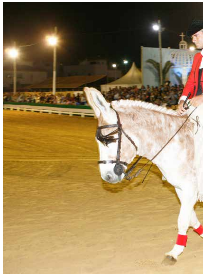
'Caramelo' volverá a la nueva edición de la Pará, que tendrá al burro como gran p

de Piedras con Mulos, de Gallinas de Pura Raza Utrerana y del Morfofuncional del Galgo Español, además de la Gymkhana a Caballo y demás actividades como exhibiciones, espectáculos ecuestres, desfiles flamencos y veladas musicales.