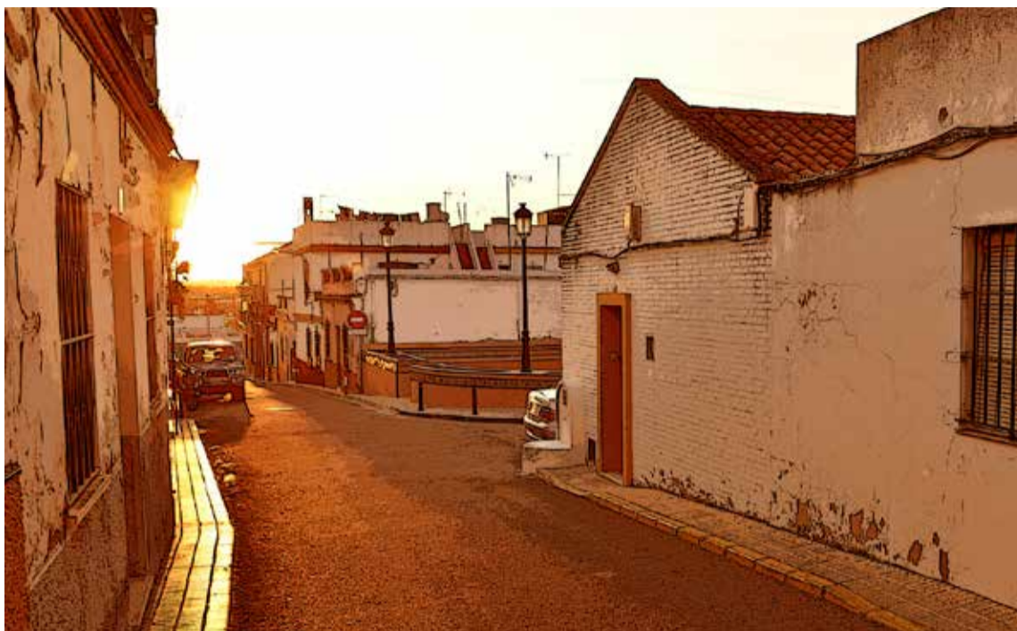
Los orígenes de la calle Sanatorio se remontan a casi noventa años.