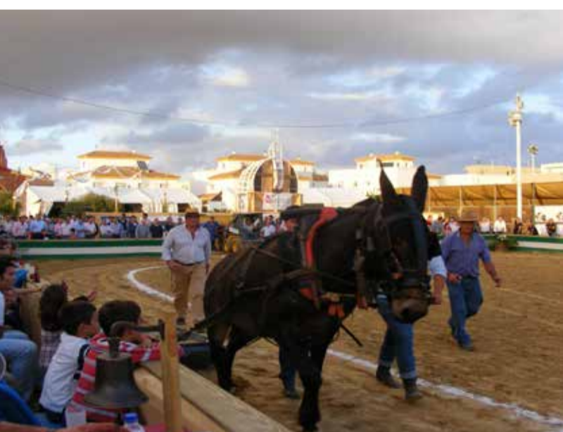
curso del arrastre de piedras con mulos es uno de los momentos más esperados cada año.

» Todas y cada una de las actividades de la Pará son gratuitas y están pensadas para el disfrute de personas de todas las edades