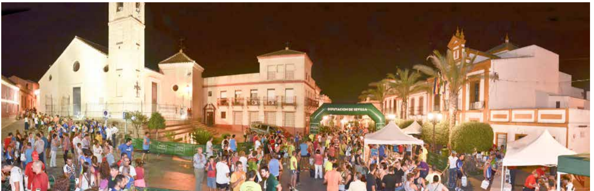
Ambiente de la Plaza de España tras la carrera.