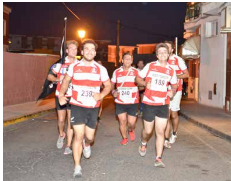
El equipo local de rugby “Los Bucaneros”.