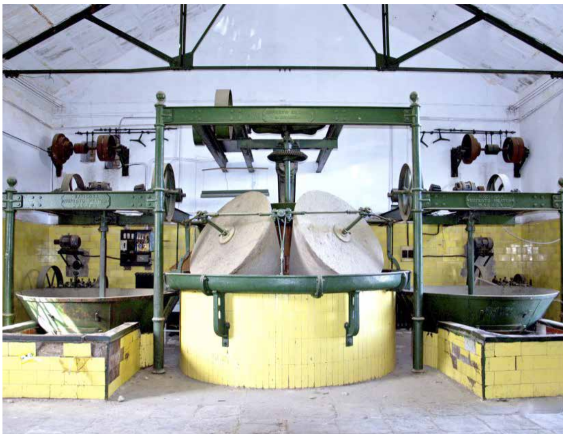
El Ayuntamiento realizó recientemente mejoras en la nave donde se encuentra la maquinaria.

Además de la organización del Día del Aceite, desde el colectivo se desarrollan de forma regular distintas actividades como talle-