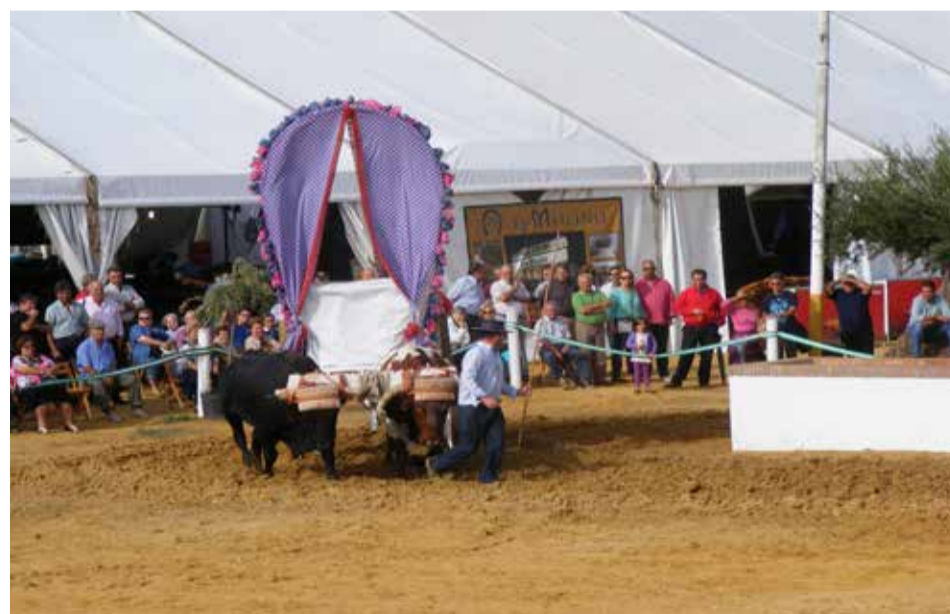
Tras una década, el certamen de yuntas sigue creciendo.

tes de Sicilia, conferencias, coloquios, mesas redondas y talleres ecológicos sobre el burro, todo ello enfocado al conocimiento y protección de estos ejemplares. Completarán lo anterior dos actividades centrales de enorme atractivo como la lectura pública