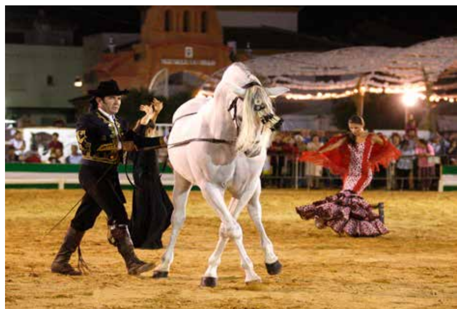
La belleza de los espectáculos ecuestres tampoco faltará en esta edición.