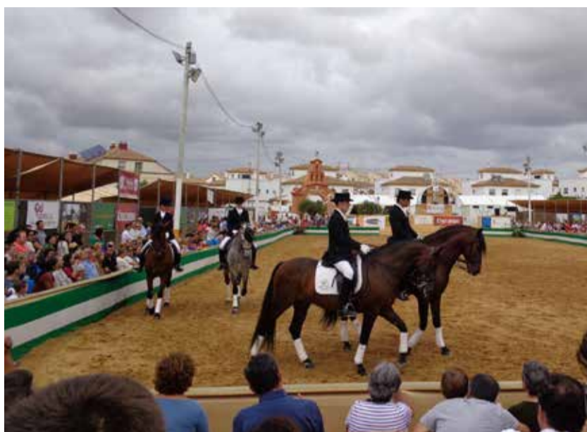
El concurso morfológico es valedero para el Campeonato de España, que se celebra en Sicab.

En esta VIII edición los asistentes volverán a disfrutar con los ya tradicionales concursos de Yuntas y Carreteros, de Arrastre