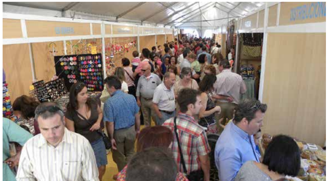
Las empresas volverán a disponer de un escaparate de lujo.